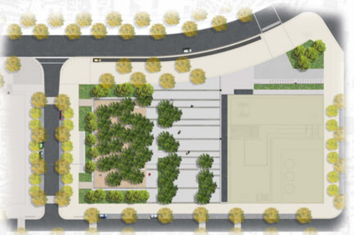
PLAN DU PROJET