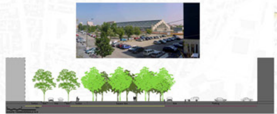
PLACE PRÉDOMINANTE DE LA VOITURE

LE PROJET SE SITUE ENTRE LES BERGES DU RHÔNE ET LA HALLE TONY GARNIER. IL EST UTILISÉ COMME PARKING. LE PROJET AURA POUR BUT DE CRÉER UNE PERCÉE DEPUIS LA HALLE TONY GARNIER VERS LES BERGES DU RHÔNE, ET DE CONSTITUER UNE PORTE D'ENTRÉE VERS LE PARC DES BERGES ET LE PARC DE GERLAND.