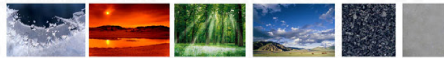
AMBIANCE FROIDE/CHAUDE AMBIANCE INTIME/OUVERTE GRANIT/BÉTON