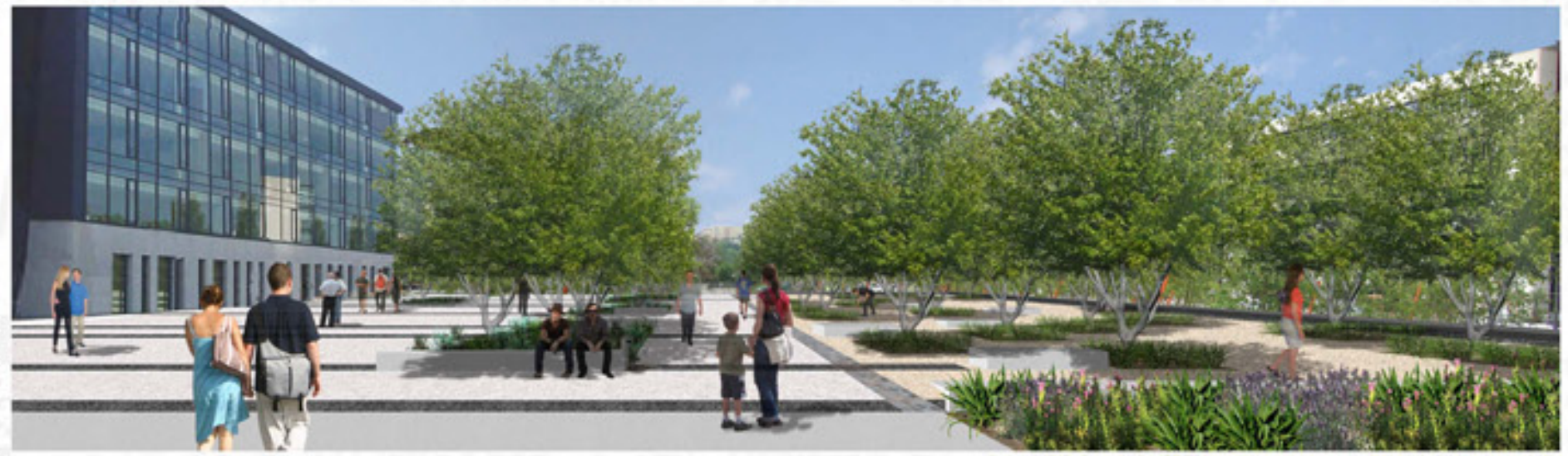
UN LIEU PROPICE À LA DÉTENTE

CE PROJET JOUE BEAUCOUP AVEC LES CONTRASTES. LES DEUX ESPACES DU PROJET FORMENT DEUX AMBIANCES DIFFÉRENTES: UNE AMBIANCE INTIMISTE DANS LE SOUS-BOIS, ET UNE PLUS OUVERTE SUR LE PARVIS. DE MÊME LA NUIT AVEC UN ÉCLAIRAGE DIFFÉRENT SELON L'ENDROIT DU PARC: BLANC GLACÉ PARTANT DU HAUT SUR LE PARVIS, LUMIÈRE NATURELLE PARTANT DU SOL DANS LE SOUS-BOIS.