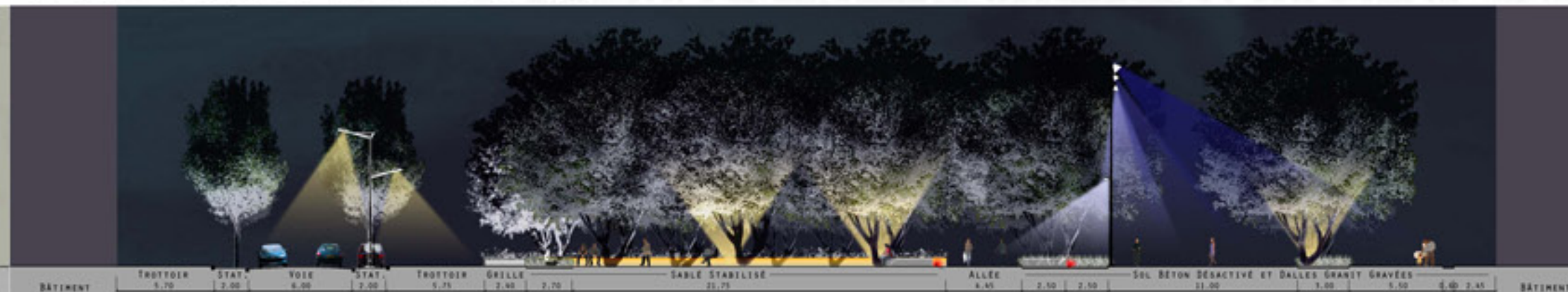
CONCEPTION DU PROJET: ITINÉRAIRE 303, LYON - PIÈCES GRAPHIQUES ET PAO: NAÏD RAPHAËL LP INFOGRAPHIE PAYSAGÈRE 2011/2012