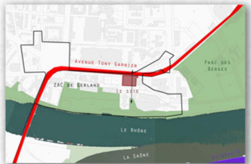
SITUATION DU SITE DANS LA ZAC DE GERLAND