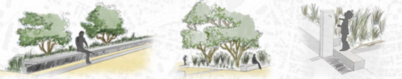
UN ESPACE DÉDIÉ À LA DÉTENTE