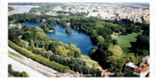
LE PARC DE LA TÊTE D'OR EST RELIÉ AU PARC DES BERGES PAR UNE PROMENADE LE LONG DU RHÔNE

LE PROJET DU SQUARE DE BARCELONE SE SITUE À LYON, AU COEUR DE LA ZAC DE GERLAND, DANS LE QUARTIER DU MÊME NOM, SITUÉ À LA CONFLUENCE DU RHÔNE ET DE LA SAÔNE, À PROXIMITÉ DE L'AUTOROUTE. IL S'AGIT D'UNE ANCIENNE ZONE INDUSTRIELLE.